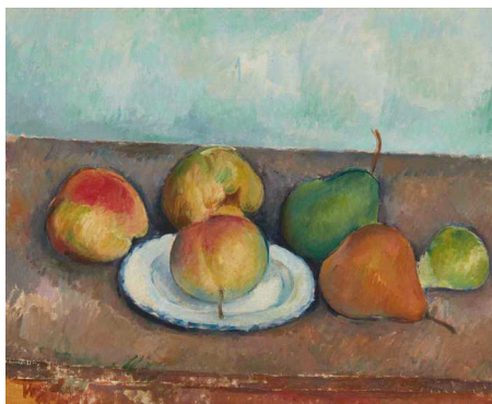
Paul Cézanne, Pommes et poires , 1888 - 1890, huile sur toile, 38,2 x 46,4 cm. Estimation : 25 - 35 millions de dollars (20 951 875 - 29 332 625 euros).