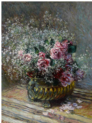
Claude Monet, Fleurs dans un pot (Roses et brouillard),

1878, huile sur toile, 83,5 x 62,4 cm. Estimation 4 - 6 millions de dollars (3 352 300 - 5 028 450 euros).